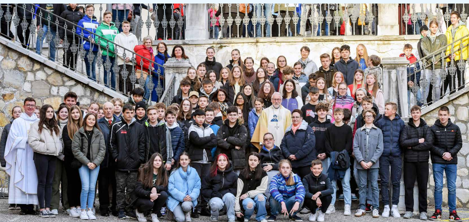
Unsere Firmlinge 2023 mit dem Bischof Josef Marketz

am 31. Oktober um 18 Uhr in der Markuskirche